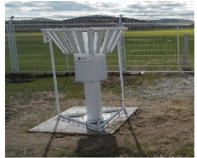
图 4 称重式雨量计

的是翻斗式雨量计,可测降雨量和降雨强度,由于称重式雨量计 [13-14] 具备固态降水观测能力,测量精度和分辨率均优于翻斗式雨量计,因此目前称重式雨量正进行业务化推广。称重式降水传感器如图 4 所示。