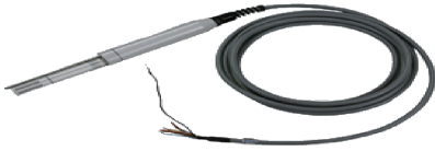
图 1 国内 PT100 温度传感器

温度范围广、稳定性好、精度高等特点,是中低温区(-200~650℃)最常用的一种温度检测器,国内目前使用的 PT100 铂电阻温度传感器如图 1 所示。