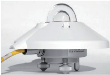
图7 国内总辐射表 Fig. 7 Domestic total radiation table

根据不同辐射源和辐射波段辐射数据的需求,目前,用于气象辐射测量的仪器主要包括绝对直接辐射表、直接辐射表、光谱直接辐射表、总辐射表、散射辐射表、分光总辐射表、净全辐射表、紫外辐射表、光合有效辐射表、地球/大气辐射表。测量总辐射,国内主要采用两个球形玻璃罩,以减少测量误差,精度较高,如图7所示。