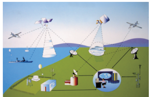
图10 综合气象观测系统 Fig. 10 Integrated meteorological observation system

第1代自动气象站始建于1950年末,结构简单,准确度低。1960年代,由于半导体元件和脉冲数字电路的发展,使得观测项目、精度、控制能力和可靠性都有了显著提高。1970年代,研制出晶体管式自动气象站,完成初步试验考核。1980年代随着单片机技术的快速发展和应用,自动站性能大幅提高。1990年代后期,我国第一批自动气象站完成设计定型并投入业务应用。近几年,我国自动气象站发展愈加成熟,逐渐向无人化、智能化发展。