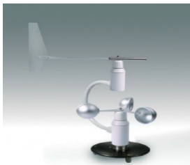
图 3 国内机械式风传感器

地面测风仪器可分为机械旋转式、风压式、散热式和超声波式 [11] ,传统的机械式风杯风向标风速风向传感器技术成熟,成本较低,但由于其长时间工作会发生机械磨损,因此人工维护成本较高,后期为克服这一缺点,设计出超声式风速风向传感器,但该传感器需要采用多个超声探头,因此成本较高 [12] ,目前业务中广泛应用的是机械旋转式测风传感器,新型的测风传感器主要有超声波测风仪、散热式风速、MEMS 热式风速风向传感器等,机械式风传感器如图 3 所示。