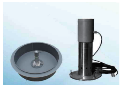
图 6 国内超声蒸发传感器

蒸发传感器主要是采集水分经蒸发而散布到空气中的量,我国气象站传统测定水面(含结冰时)主要使用的仪器有小型蒸发器和 E601B 型蒸发器,2003 年起 AG1-1 型超声波蒸发传感器在基准气候站正式投入使用,用于测量非结冰期的水面蒸发量,该传感器精确度高、稳定性好、故障率低,但恶劣环境下易出现野值 [15] ,因此目前业务上主要采用高精度超声波探测,内置温度补偿以提高精度,如图 6 所示。