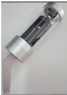
图8 国内数字日照传感器 Fig. 8 Domestic digital sunshine sensor

传统用来测量日照的仪器主要是暗筒式日照计和聚焦是日照计,2001年以来,采用直接辐射表进行同步观测 [5] ,但由于传统日照计自动化程度低,测量结果主观性强,精度较低,资料的可比性和一致性难以保证 [16] ,经过技术的发展,研制了一些新型的日照计,主要有光热型日照计 [17] 、光电型日照计 [6] 等,目前国内日照计自带嵌入软件计算日照时数,并具备状态监测、自动加热以及温度补偿等功能,如图8所示。