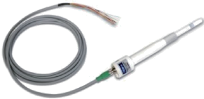
图 2 国内湿度传感器

对于湿度的测量,早期主要采用干湿表、毛发湿度表等实现人工读数或半自动自记测量,随后湿敏电容传感器和湿敏电阻传感器广泛应用于自动化测量,还用于测量霜、露 [10] ,由于其相应迅速,测量大气湿度廓线准确度较高,因此也广泛应用于探空仪中,目前国内使用的湿度传感器如图 2 所示。