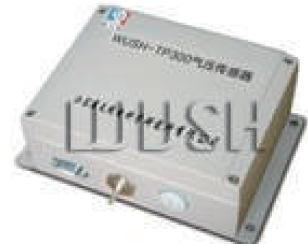
图 5 国内气压传感器

气压测量方面,传统采用的是振筒式气压传感器,硅膜盒电容式气压传感器是新型气压感应元件,但目前仍采用芬兰 VAISALA 公司的气压传感器,国产气压传感器的使用仍需进一步研究。国内使用的气压传感器如图 5 所示。